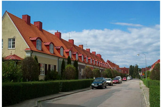
Lindengatan i Linköping.

Flera förstäder runt de svenska storstäderna kom att uppföras som trädgårdsstäder. Förorter till Stockholm som Djursholm och Saltsjöbaden, med villabebyggelse från 1890-talet, har ibland setts som tidiga trädgårdsstäder. Mer tydliga exempel är Enskede, ”den första svenska trädgårdsstaden”, som började anläggas på sommaren 1908 och Äppelviken. Men även i mer begränsade områden, som de fyra kvarter vilka bildar Röda stan i Norrköping eller gatumiljöer vid Lindengatan och Konsistoriegatan i Linköping är trädgårdsstadsidealet tydligt om än i olika varianter.