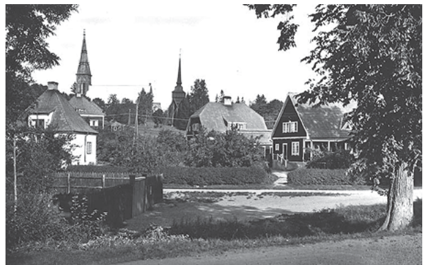
Åtvidaberg blir under början av 1900-talet ett modernt villasamhälle.