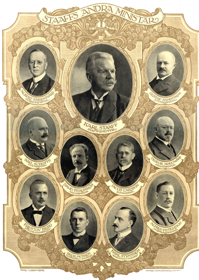
Karl Staaffs andra ministär 1911 - 1914, där Theodor Adelswärd ingick som finansminister. Han är avbildad längst till höger i mittenraden. Privat bild.

Adelswärd's ställning under regeringsåren blev inte helt oomstridd. Han kom nämligen 1913 att förorsaka den Staaffska ministären en svår prestigeförlust och skadade samtidigt den grund som regeringens ställning vilade på - vänster-samverkan. Statsrådskollegorna accepterade då ett förslag från finansministerns sida, som betydde en successiv sänkning av tullen på socker. Tanken var, att man skulle tillmötesgå krav från konsumenthåll. Planen mottogs med kraftiga protester från betodlarhåll, som livligt uppbackades av skånska bettrusten. Adelswärd blev kritiserad för att han inte i tillräcklig utsträckning utrett förslaget's konsekvenser på olika områden. Situationen kom följaktligen att skapa irritation inom regeringen och de liberalas led. Ministären såg sig slutligen nödsakad att överge den ursprungliga linjen. I stället ställde man sig bakom en kompromiss, som uppnått i riksdagen mellan liberaler och högermän. Det blev också den lösningen av frågan som riksdagen accepterade. Trogna det ursprungliga regerings-förslaget blev i första hand socialdemokraterna, förutom ett mindre antal liberaler. Behandlingen av sockertullen 1913 har för eftervärlden blivit känd som "sockerparlamentarismen". I stället för en lösning byggd på vänstersamverkan uppnåddes en improviserad uppgörelse mellan högern och majoriteten regeringstrogna liberaler.