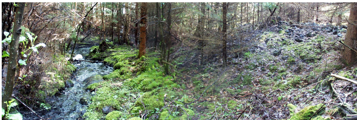
Lämningar efter en hyttplats vid sjön Djupgällen mellan Bersbo och Ätvidaberg.