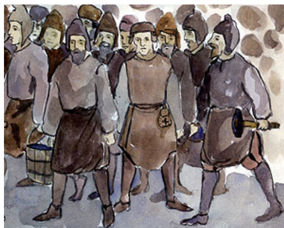
Medeltida gruvarbetare.

Man anger villkoren för malmbrytningen i bästa samförståndsanda; deltagarna skall gemensamt