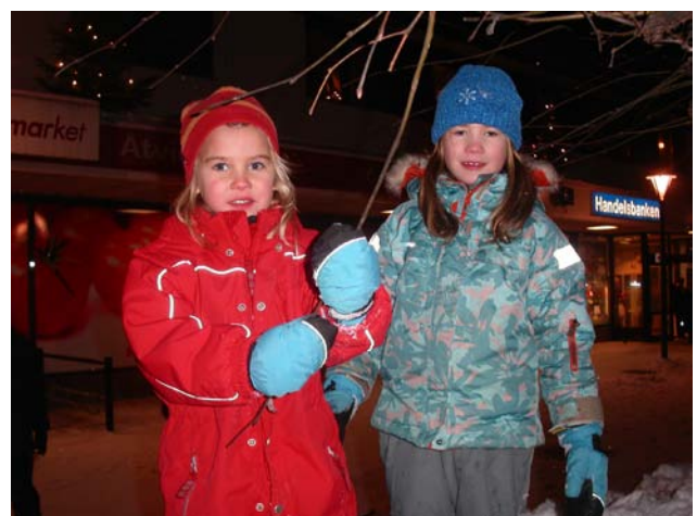
Brukskultur Åtvidaberg tackar alla medverkande och utlånare av lucka